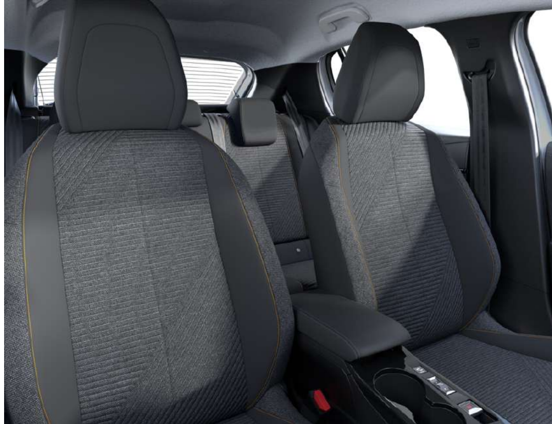
Sellerie tissu RENZO, accompagnement Rimini, surpiqûres Orange Sunrise