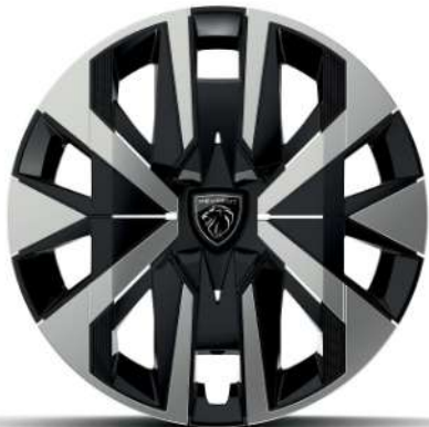
Jantes tôle 16" avec enjoliveurs MONTI Gris Eclat avec vernis brillant & noir grainé