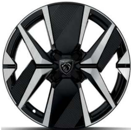
Jantes alliage 17" diamantées YANAKA bi-ton vernis brillant et Noir Orbital avec inserts Noir Orbital et vernis mat