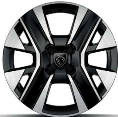
Jantes alliage 16" diamantées NOMA bi-ton vernis brillant et Noir Orbital