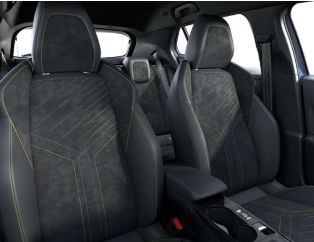
Sellerie Alcantara® Mistral ICONIUM accompagnement TEP Isabella, trimatière Alcantara Noir et surpiqûres Vert Adamite WNFX En option sur GT