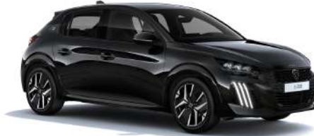
Noir Perla Nera

M0LD - Option Non disponible sur STYLE et BUSINESS