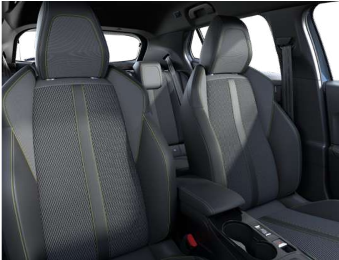
Sellerie tissu BELOMKA, accompagnement TEP Isabella, trimatière Uni Capy et surpiqûres Vert Adamite ATFX De série sur GT