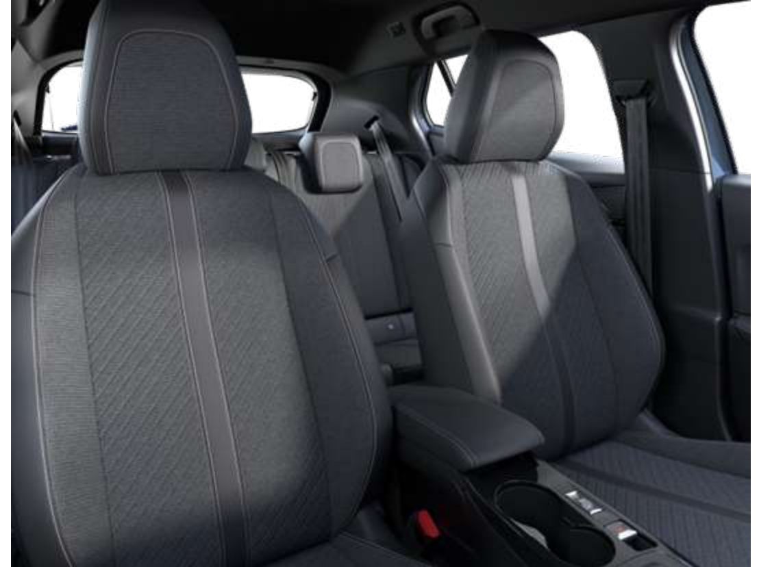
Sellerie tissu CASUAL LOMSA embossé, accompagnement TEP Isabella, tri-matière LOMSA et surpiqûres Quartz